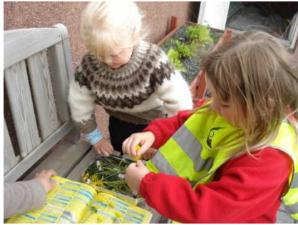
að þurrka blóm