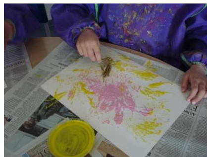
mála ð me ð el ftingu