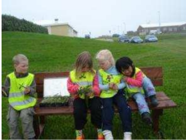
Fyrsta blómaferðin- Krakkakot í baksýn (rauð bygging).

Heilsuleikskólinn Krakkakot er 2 deilda leikskóli með börnum á aldrinum 1-6 ára. Barnafjöldinn í vetur var 52 börn. Frá opnun 2001 hefur mikil áhersla verið lögð á umhverfið, náttúrvemd og heilsu okkar allra. Í Aðalnámskrá leikskóla eru áhersluþættir í leikskólauppeldi flokkaðir í 6 námssvið. Þau eru hreyfing, málrækt, myndsköpun, tónlist, náttúra og umhverfi ,