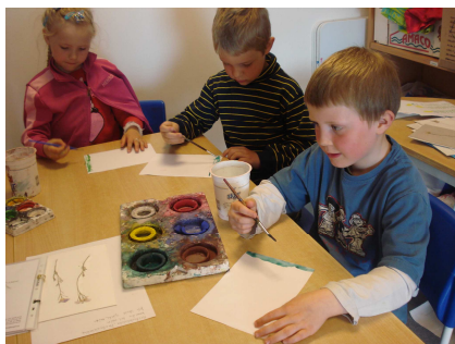
va tnsli t ir, va xli t ir