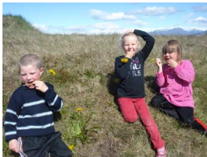
að smakka á blómum