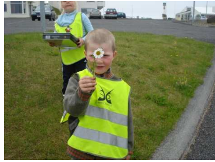
að þekkja blóm